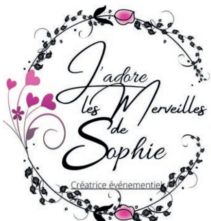
J'adore les merveilles de Sophie créatrice événementiel - Sophie CARTON 79 bis rue de la Forge - HUNTING