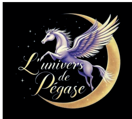
L'univers de Pégase Créatrice de bijoux avec des pierres naturelles. Sophie CARTON - 79 bis rue de la Forge - HUNTING Page Facebook et Instagram dédié à mes deux univers